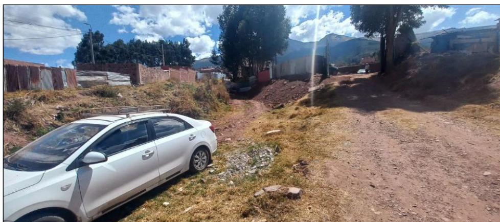
FIGURA N°02: TRAMO CRÍTICO EN LA QUEBRADA PURGATORIO, DISTRITO DE SAN JERONIMO, PROVINCIA DE CUSCO - CUSCO, SE APRECIA EL CAUCE COLMATADO