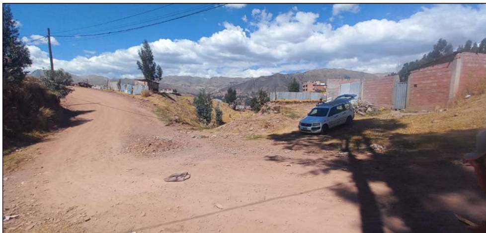
FIGURA N°01: TRAMO CRÍTICO EN LA QUEBRADA PURGATORIO, DISTRITO DE SAN JERONIMO, PROVINCIA DE CUSCO - CUSCO, SE APRECIA EL CAUCE